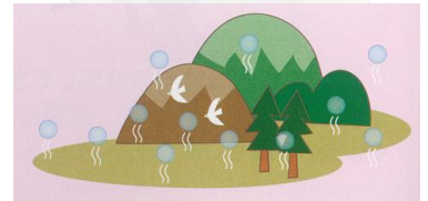
身の周りの放射線 大地の放射線（世界）

ナノグレイ時（ミリシーベルト年） 実効線量への換算には0.7シーベルトグレイを使用