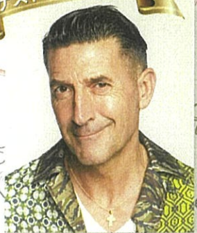
パンツェッタ・ジローラモ