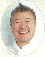
(一社)日本イタリア料理協会 会長