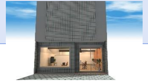
サテライトオフィス(上市町)