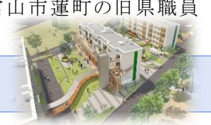
創業支援施設等のイメージ