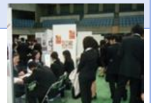
合同企業説明会イメージ

就職氷河期世代・第二新卒等の正規雇用を支援するため、研修や合同企業説明会に加え、企業向けセミナー、就職後の定着支援などを総合的に実施