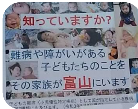
▲啓発用リーフレット