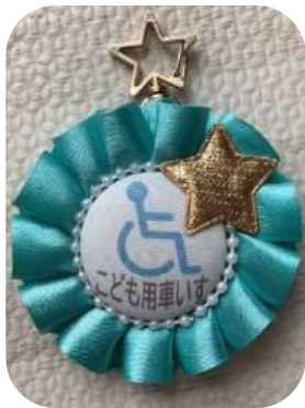
▲ワークショップ作品