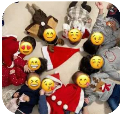
▲クリスマスイベントの様子 (富山市町村・ママスキーハウス)