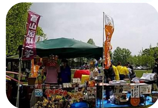
▲イベント開催時の様子 (射水市・ママスキーパーティ2021)