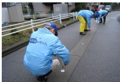
地下水の守り人の活動状況 (消雪設備の点検)

令和2年度には、守り人の地域での活動を支援するため、名水の保全や消雪設備の維持管理に関する技術講習会を開催した。