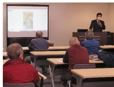
技術講習会の様子