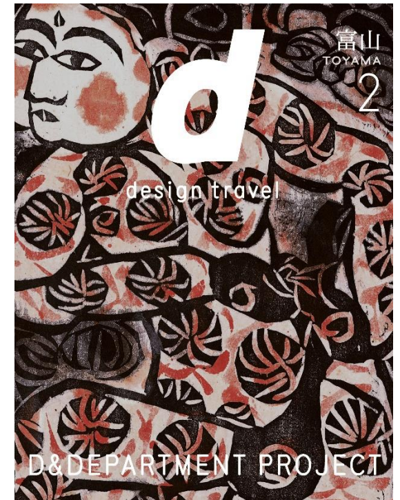
表紙「祭巴の柵」棟方志功