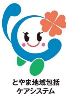
とやま地域包括ケアシステム