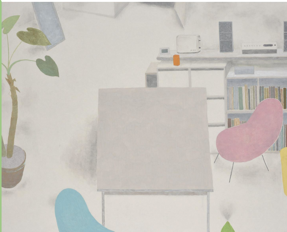
尾長良範《zone》2019年 作家蔵

開館時間 午前9時30分～午後6時(入室は午後5時30分まで) 休館日 月曜日、2月24日 主催 富山県水墨美術館、富山県水墨美術館友の会、富山新聞社、北國新聞社、チューリップテレビ 協賛 トヨタカローラ富山、スギノマシシ、ユニゾン、デュプロ北陸販売(順不同)