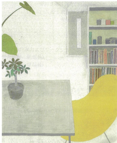
尾長良範《zone》2020年 作家蔵