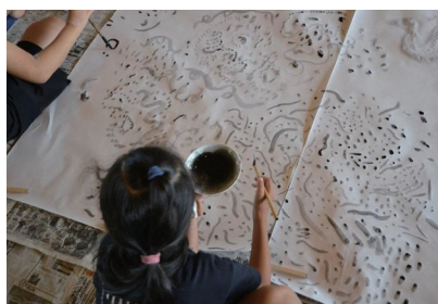
ワークショップの様子(2021年7月26日開催)

当館では、新型コロナウイルス感染症の拡大防止対策に取り組みながら開催しております。ご来館の際は、マスク着用や手指の消毒など、感染防止の取り組みにご協力ください。また、展示室への入場制限をおこなう場合がありますのでご理解のほどお願いいたします。