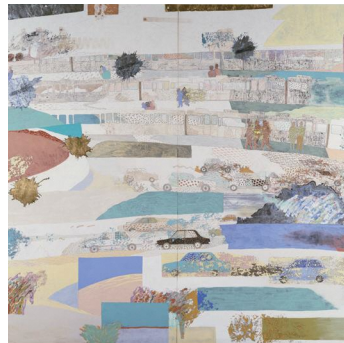
尾長良範《scene》1988年 東京都現代美術館蔵