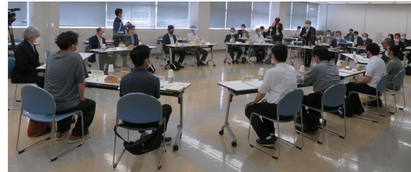
R3.6.11 高岡で第1回KOGEIミライ会議