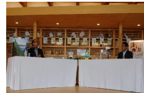
岐阜県知事との懇談会 R3.7.14(岐阜市)