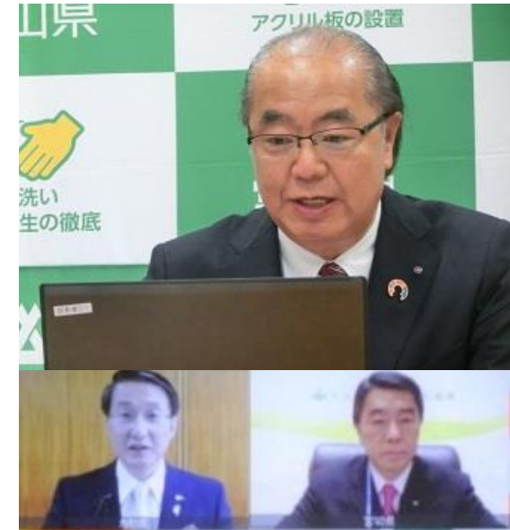
WEB会議で平井会長(鳥取県)、 村井国民運動本部長(宮城県)と意見交換