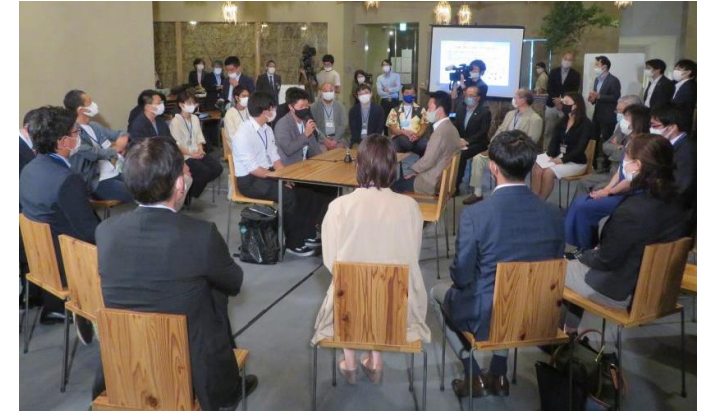
R3.10.7 立山町でのビジョンセッション