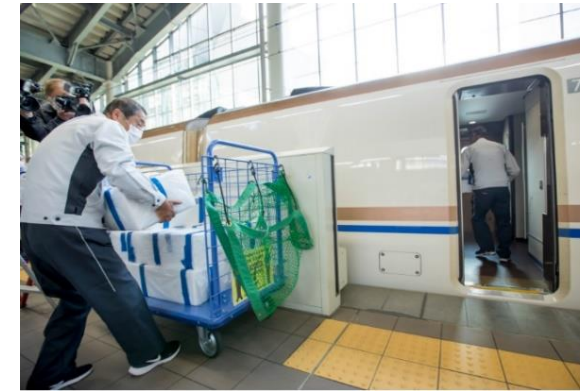
北陸新幹線で今朝獲れ鮮魚を輸送