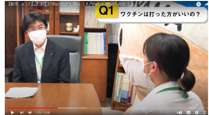
県庁有給インターンシップの学生が作成した動画