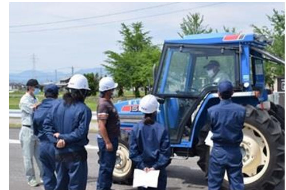
スマート農業普及センターでの研修