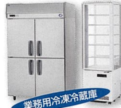
業務用冷凍冷蔵庫