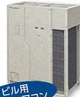
ビル用 マルチエアコン