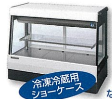
冷凍冷蔵用 ショーケース