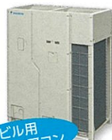
ビル用 マルチエアコン