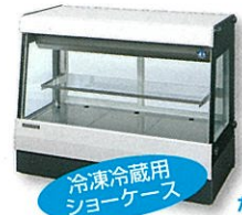
冷凍冷蔵用 ショーケース