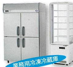
業務用冷凍冷蔵庫