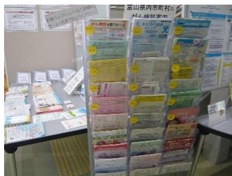
R2年度 がんに関する展示ブースの様子