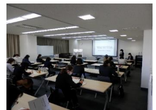
R2年度 研修会の様子