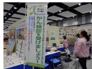
R2年度 がん検診啓発用ブースの様子