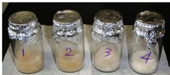
分析に使用したコラーゲン