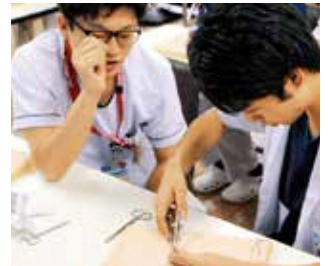
縫合のレクチャー