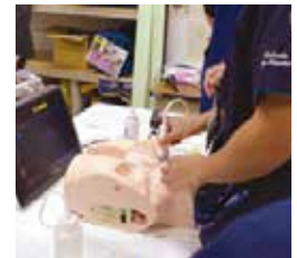
ハンズオンセミナー