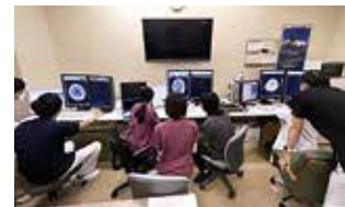
レクチャー in 放射線科