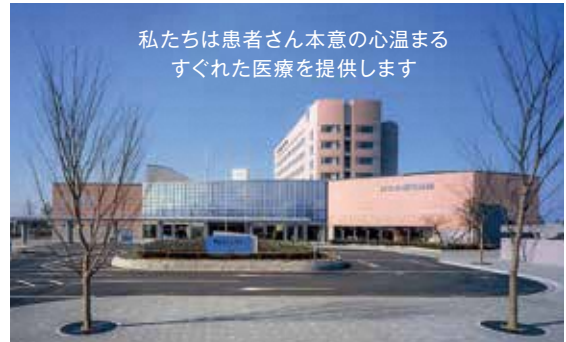
私たちは患者さん本意の心温まる すぐれた医療を提供します

富山市北部地区および富山医療圏の中核病院としての役割を担うべく、済生会の設立理念「施薬救療（無償の医療）」を大切に、「健康寿命の延伸」「生活の質の向上」「働きがいのある職場環境の形成」を目指し、地域の皆様の健康を支えるべく、職員一丸となって歩んでいます。