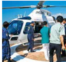
ヘリポートの様子

児科医1名、麻酔科医1名、放射線科医1名が常駐しており、救急当直中も充実した指導体制をとっています。