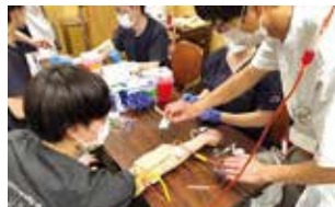
採血・ルート確保の指導・練習