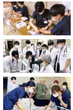
○研修ローテーション例