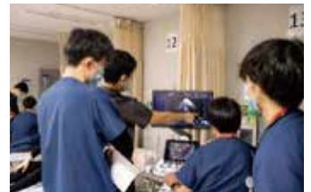
○ 研修ローテーション例