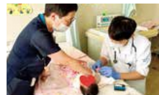
小児科・新生児のルート確保に挑戦