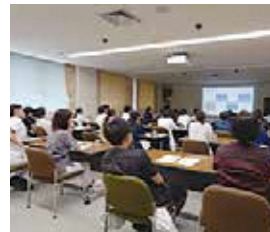
研修医向けセミナーの充実