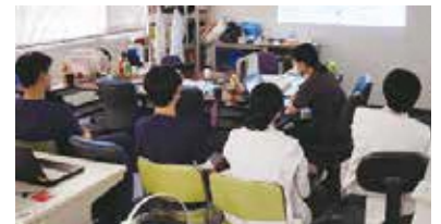
○ 研修ローテーション例