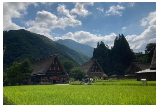
五箇山合掌造り集落