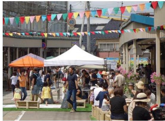
商店街のイベント