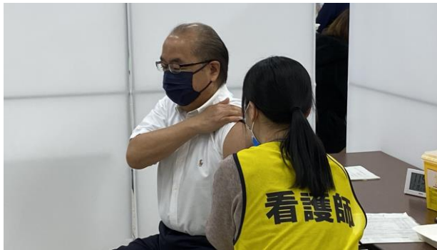
新型コロナウイルスワクチン接種

全国規模の大会への本県からの参加者が、大会出場の前後にPCR検査を行う必要が生じた場合の検査費用を支援