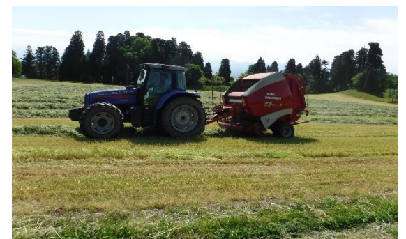
飼料となる牧草の収穫風景