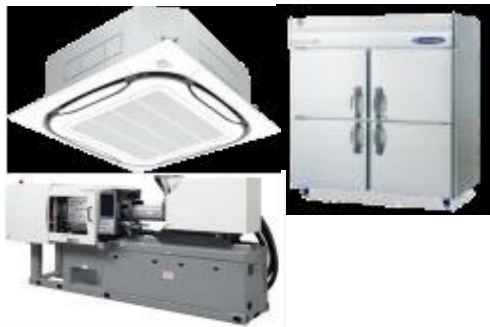
優れた省エネ設備のイメージ(資源エネルギー庁資料より抜粋)

賃上げ等に取り組む県内中小企業を支援するため、国の「業務改善助成金」について、県の上乗せ助成を実施