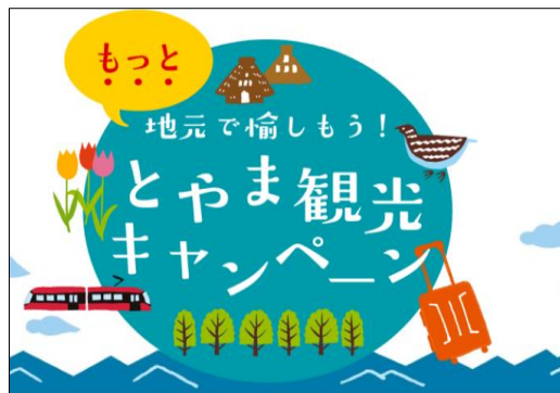
地元で愉しもう！とやま観光キャンペーン

新型コロナによる旅行者減少の影響を受ける県内観光交通（観光列車・バス等）の旅行商品化・販路開拓を支援