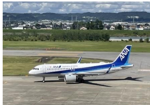
富山きときと空港