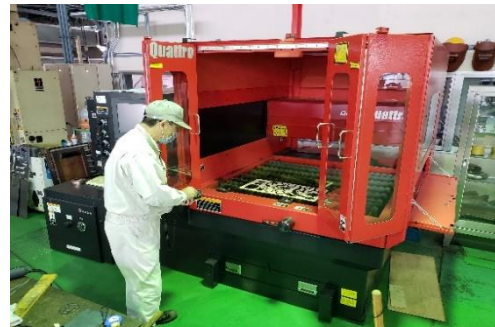
事業所における作業風景(イメージ)