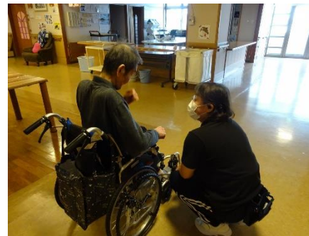
介護サービスの提供