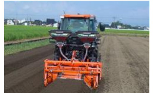
園芸農業用機械(イメージ)

原油価格の高騰による林業事業者や木材加工事業者の負担を軽減するため、省エネ型の林業機械や木材加工設備の導入を支援