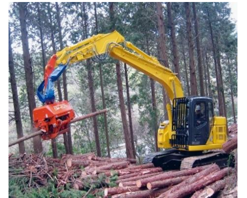
林業機械(イメージ)