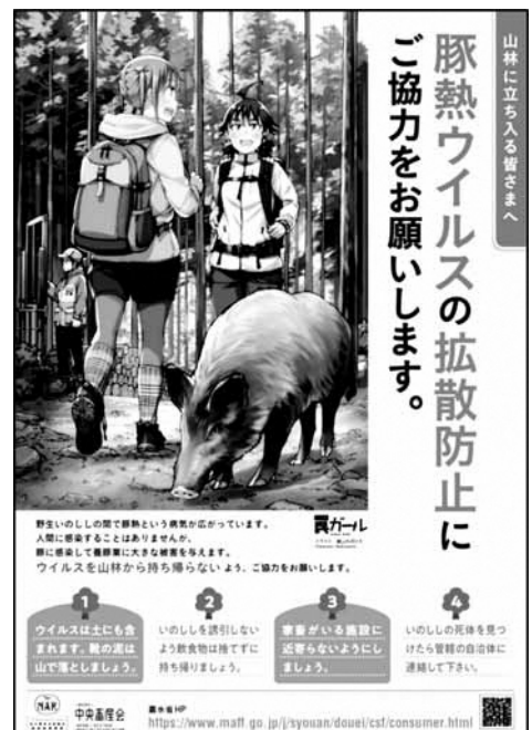
狩猟者、入山者への注意喚起ポスター

関係者の皆様におかれましては、県内の野生いのししにおいて豚熱陽性事例が確認されていないから安全と考えるのではなく、県内に再び豚熱ウイルスが侵入する可能性があることを意識して、野生動物の侵入防止に努めていただきますようお願いいたします。