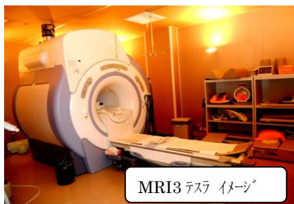
MRI3 レスラ イメージ

がん等の診断を最先端のMRI・CT等の高度検査機器による精密診断で早期発見を実施