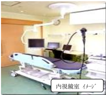
内視鏡室 イメージ

食道・胃・大腸がん等の早期がんに対して、内視鏡的粘膜下層剥離術（ESD）など最新の内視鏡治療を実施