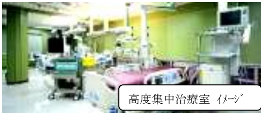
高度集中治療室 イメージ

通常時は集中的治療・看護を行う高度集中治療室として、大規模災害時や新型インフルエンザ発生時は緊急対応病室として活用