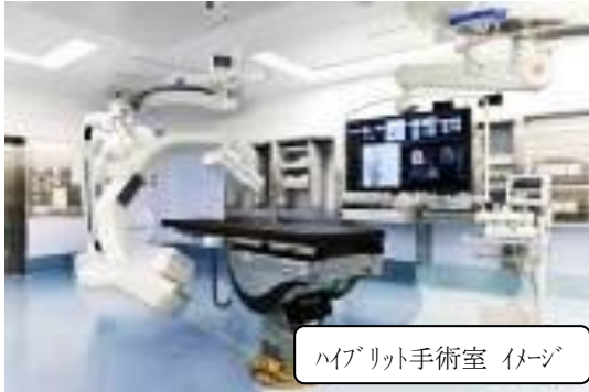
ハイブリッド手術室 イメージ

がん患者等に身体的負担の少ない鏡視下手術やロボット手術、ハイブリッド手術など先進的な手術を実施