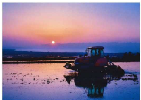
一般部門 最優秀賞 「黄昏の富山湾を望む」(滑川市)

農山村地域の景観や田舎暮らし等の魅力を広く知ってもらい、その維持・保全や活性化を図るため、「とやまの農山村写真展」を開催。