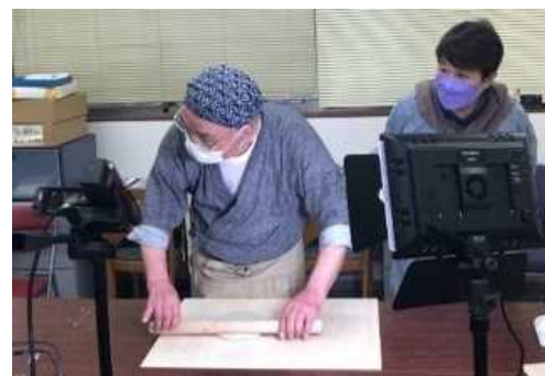
オンラインでの実施の様子 (やまだ村塾)