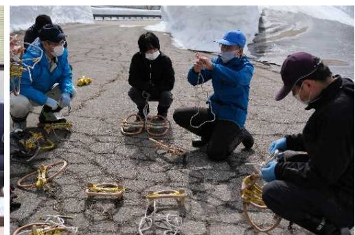
現地での実施の様子 (五箇山塾)