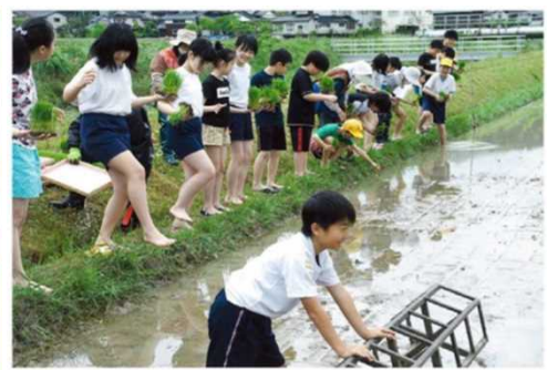
ジュニア部門 最優秀賞 「はじめての田植え」(氷見市)