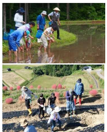
活動の様子 (上.南砺市、下.魚津市)