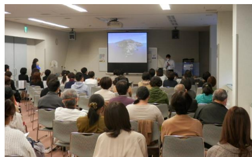
R2.10.17 小児・AYA世代のがん講演会の様子