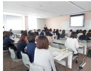
R1.8.30 養成研修会の様子