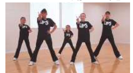
岩手県大会応援大使 Lips Dance Schoolのみなさん