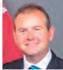
カナダ ウェイン・エワスコ マニトバ州教育・幼児教育大臣 【5/12-15】