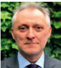
EU ステファン・ヘルマンズ 欧州委員会 教育・青少年・スポーツ・文化総局 政策戦略・評価担当局長 【5/12-15】