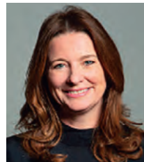
英国 ジリアン・キーガン 教育大臣 【5/13-14】