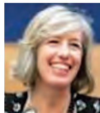
UNESCO ステファニア・ジャンニーニ 事務局長補 【5/13-14】