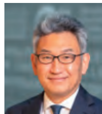
OECD 武内 良樹 事務次長 【5/13-15】