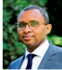
フランス バップ・エンディアイ 国民教育・青少年大臣 【5/12-14】