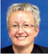
カナダ ティナ・ナミエスノウスキ 雇用・社会開発省上級副次官 【5/12-14】