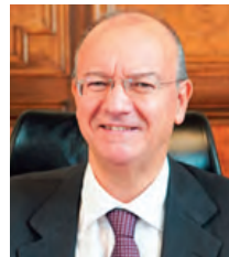
イタリア ジュゼッペ・ヴァルディターラ 教育・功績大臣 【5/12-14】