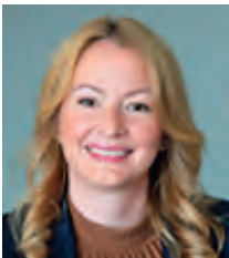
ドイツ クリスティーネ・ シュトライヒャート=クリヴォー ザールラント州教育文化大臣 【5/12-15】