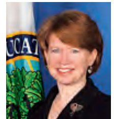
米国 マウリーナ・マクローリン 教育長官上級顧問 兼 国際問題担当部長 【5/12-15】