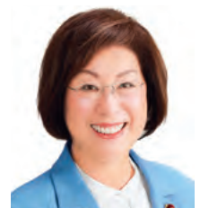
日本 永岡 桂子 文部科学大臣 【5/12-15】