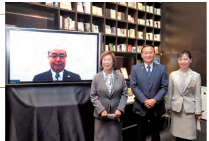
高志の国文学館にて、新田知事や藤井市長と記念撮影