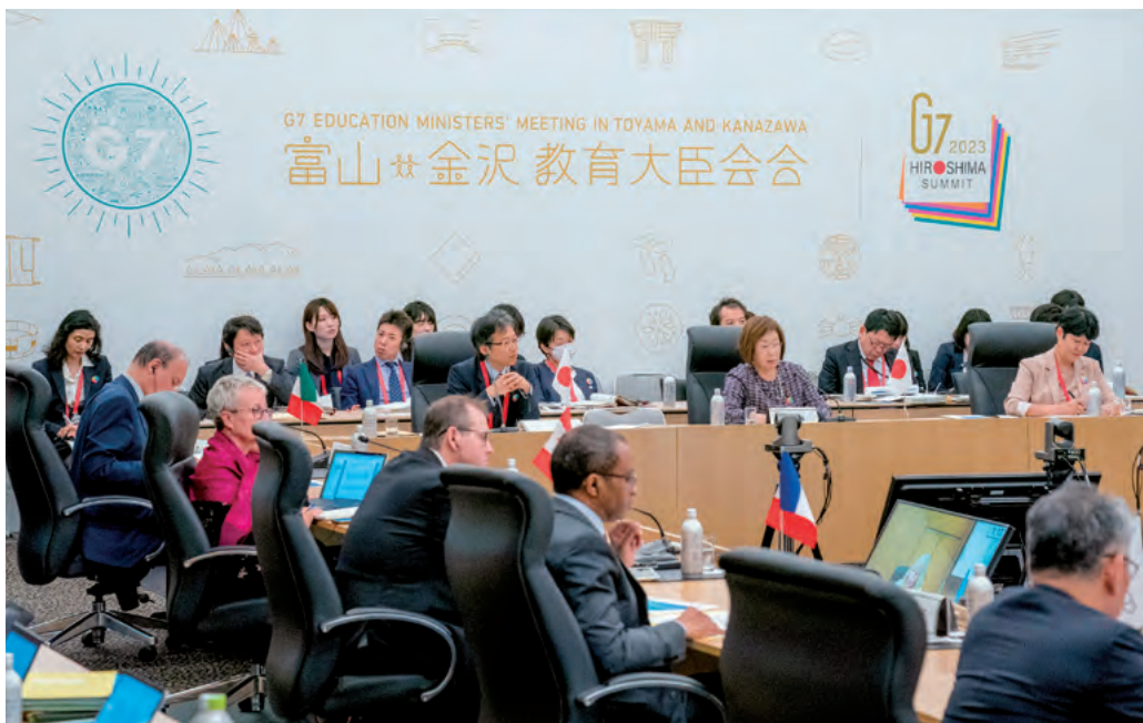
大臣会合セッション