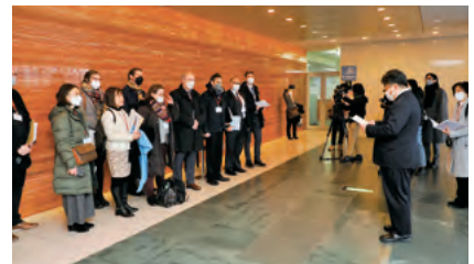
富山国際会議場での歓迎挨拶