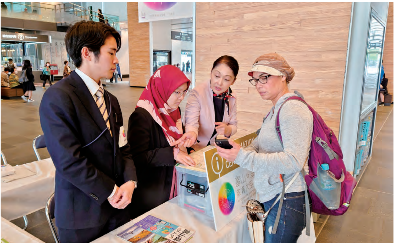
総合案内所での案内