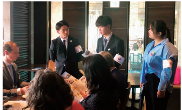
会合関係者昼食会での通訳補助