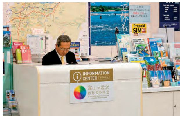
富山きとときと空港