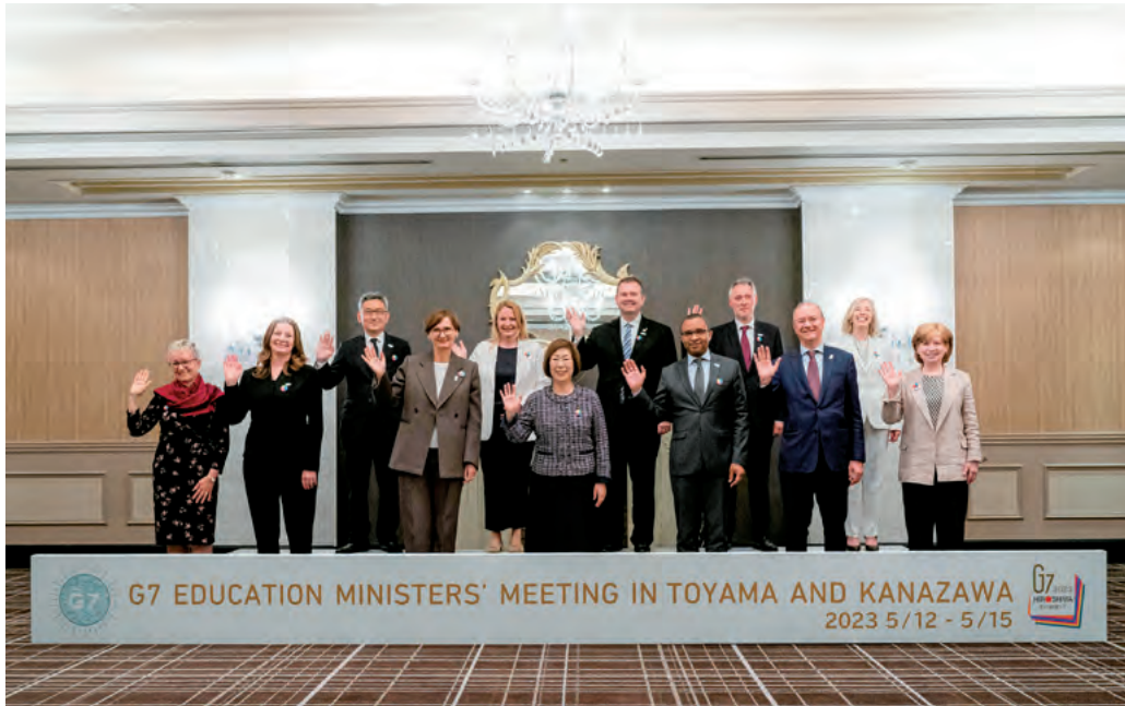
G7富山・金沢教育大臣会合 公式フォトセッション