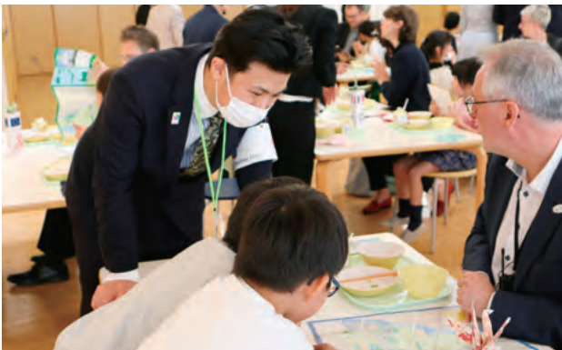
エクスカーションでの通訳補助