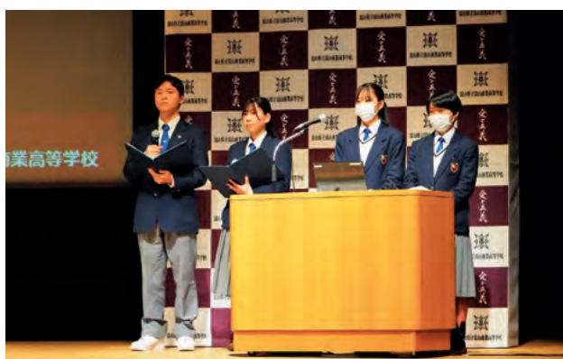
発表 富山商業高校

社会や地域の課題解決をテーマに、探究的な活動を進めてきた高校の代表生徒がその成果を発表しました。また生徒交流会を通じて、学校同士のつながりを深め、探究的活動の一層の充実を図りました。