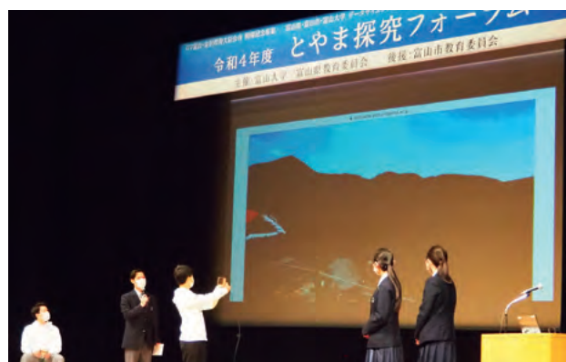
発表 富山北部高校