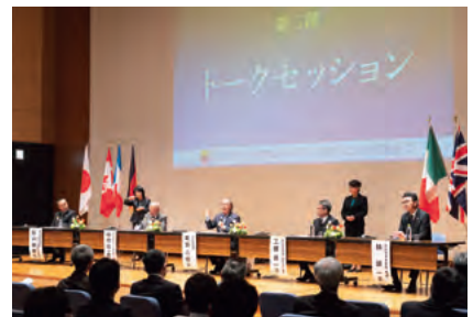
トークセッション