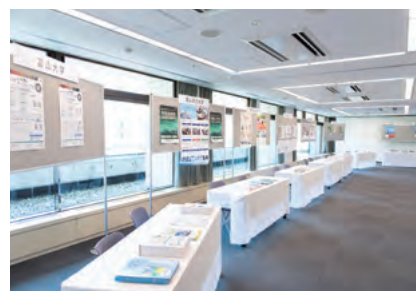
情報発信コーナー