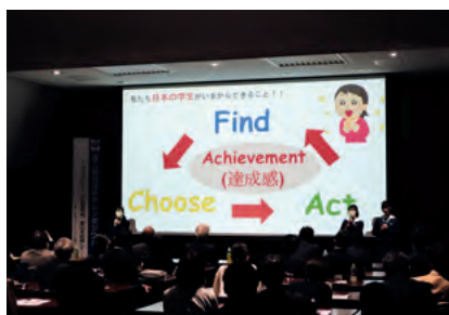
高校生による探究活動の成果発表