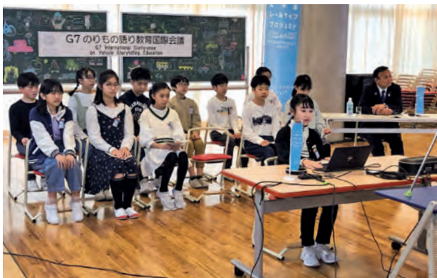
オンラインでの意見交換

各都市からは、「また実施してほしい」、「今後も交流を続けたい」など賞賛の声が複数あがりました。