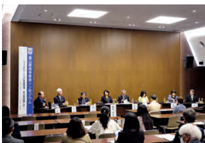
学長らによるパネルディスカッション

G7富山・金沢教育大臣会合の開催に併せ、県内3高校(大門高校、氷見高校、富山南高校)の生徒による探究活動の成果発表や、県内高等教育機関の学長らによるパネルディスカッションを通じ、高等教育機関が果たす役割を考えるシンポジウムを開催しました。その他、会場には県内の7高等教育機関による情報発信のためのコーナーも設けました。