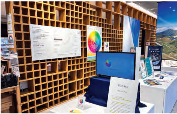
日本橋とやま館での展示

G7富山・金沢教育大臣会合に関連する展示及び本県の観光資源のPRを実施しました。同時期に、石川県の首都圏アンテナショップ「いしかわ百万石物語・江戸本店」でも会合のPRイベントを開催しました。