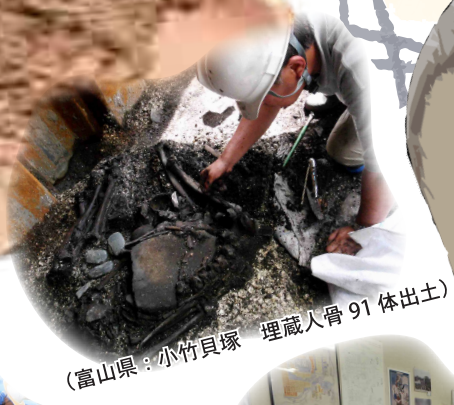
(富山県：小竹貝塚 埋蔵人骨 91体出土)