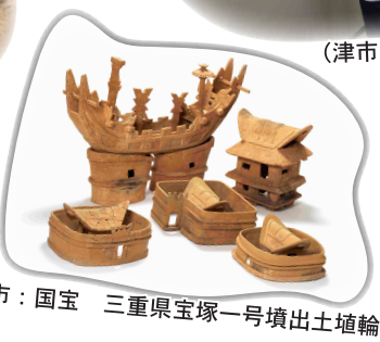
(松阪市：国宝 三重県宝塚一号墳出土埴輪)