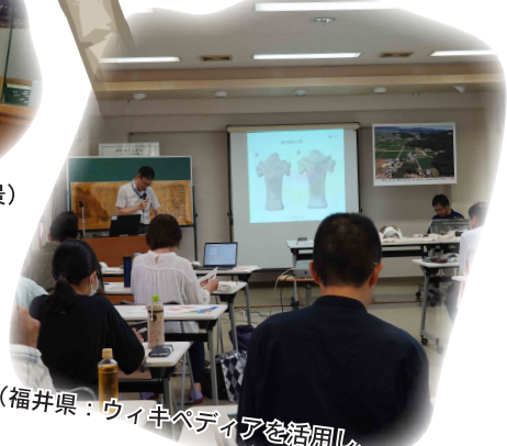
(福井県：ウィキペディアを活用し、遺跡の魅力発信)