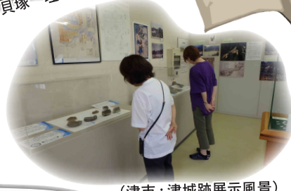
(津市：津城跡展示風景)