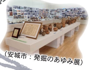
(安城市：発掘のあゆみ展)

埋蔵文化財とは、先人が地中に残した生活文化の痕跡です。私たちは、発掘調査などを通して、これらを未来へつなげる活動をしています。