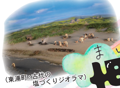
(東浦町：古代の塩づくりジオラマ)