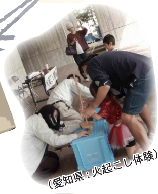
(愛知県：火起こし体験)