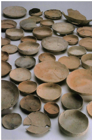
大量に出土する土師器皿

室町時代から戦国時代の城館跡からは、大量の土師器皿（かわらけ）が出土します。北畠氏館跡の出土遺物の90%以上は土師器皿です。