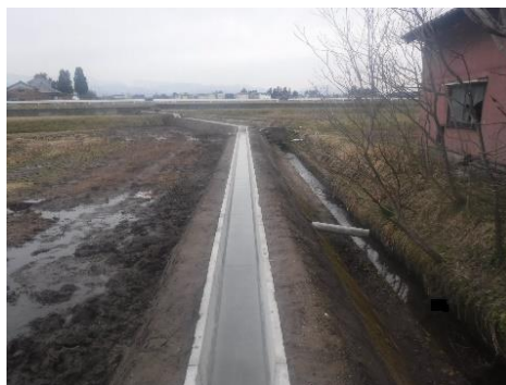
農業用水路の改修