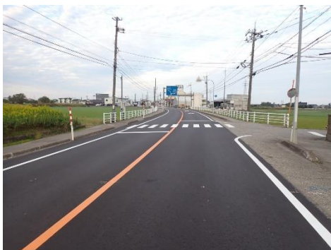
道路の舗装補修(補修後)

環境保全、地域活性化などの一般会計事業等を支援するため、電気事業会計の利益剰余金を繰出すもの