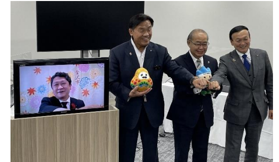
開催県・市四者による意見交換

本県の観光資源や食などの魅力発信につなげるため、首都圏のアンテナショップにおいて、関係閣僚会合を開催する他の自治体と連携したPRを実施