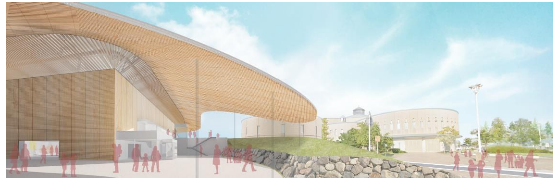
高岡テクノドーム別館（イメージ）