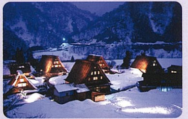
世界遺産・五箇山合掌造り集落(南砺市)