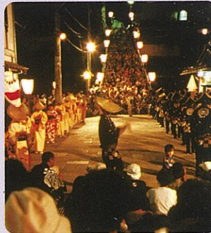
おわら風の盆(富山市)