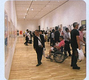
世界ポスタートリエンナーレトヤマ(富山県美術館)