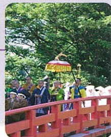
布橋灌頂会(立山町)