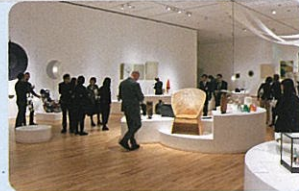
国際北陸工芸サミット(富山県美術館)