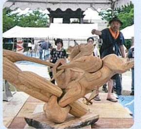
いなみ国際木彫刻キャンプ(南砺市)