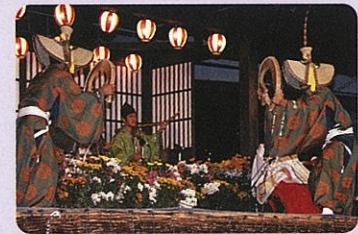
こきりこ祭り(南砺市)