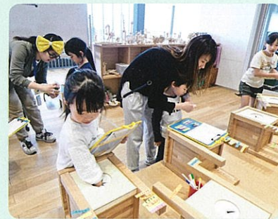
オノマトペをテーマとしたワークショップ(富山県美術館)