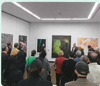
美の祭典 越中アートフェスタ(県民会館)