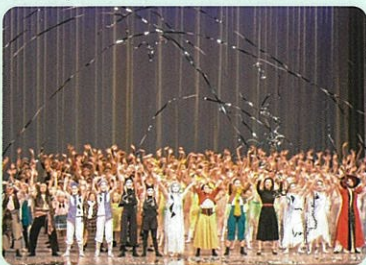
とやま世界こども舞台芸術祭(オーバード・ホール)

課題 子どもたちが文化に親しむ機会の拡充、学校教育と連携した文化活動の充実、ふるさと富山への愛着や誇りの涵養