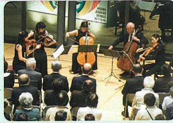
とやま室内楽フェスティバル(富山市、魚津市ほか)