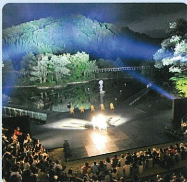
利賀サマー・シーズン(利賀芸術公園)