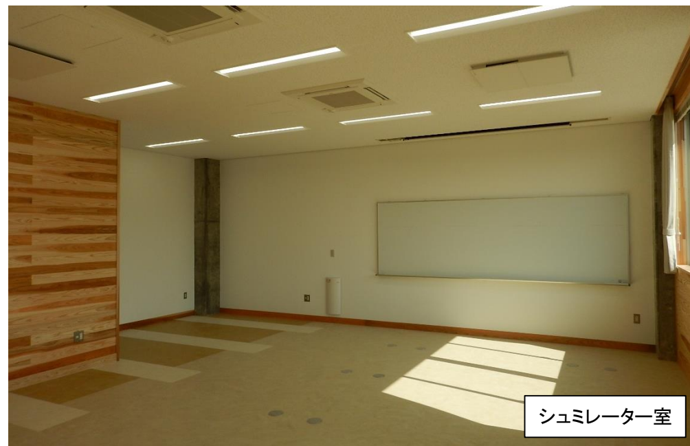
シュミレーター室