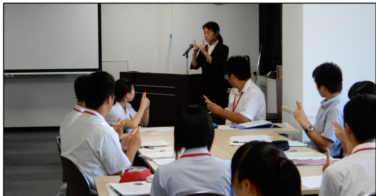
講座等による普及促進