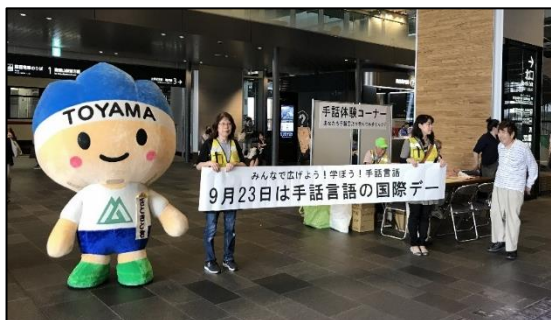
手話言語の国際デー街頭キャンペーン

イベント等への手話コーラスの派遣、手話体験カフェの開催、街頭キャンペーン等により、手話の魅力を発信し、県民の理解促進を図る。(R1～)