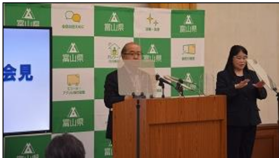
緊急記者会見での手話通訳