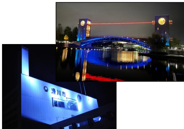
「手話言語の国際デー」に合わせてライトアップが実施された(R4)