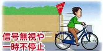
信号無視や一時不停止