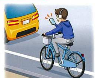
ヘッドホンや携帯電話を使用しながらの運転