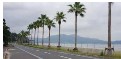
ヤシの並木が美しい