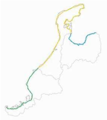
北陸サイクリングルート 富山湾岸～天橋立800km