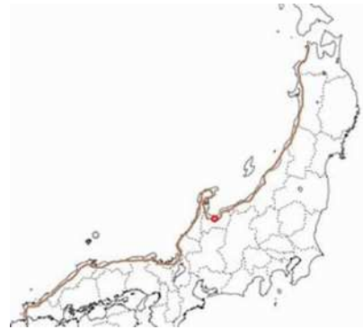
富山が中心に位置する日本海サイ クリングルート2500km ヨーロッパではユーロヴェロ9万km