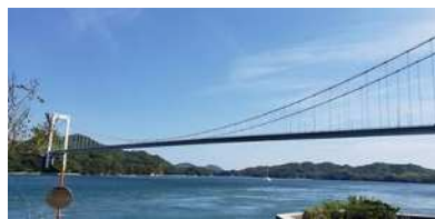
7本の橋を気持ちよく走る

広島県尾道市と愛媛県今治市を結ぶ70kmのコース。 7つの島に掛かる7本の橋の専用道路を走る。