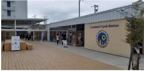
今治駅サイクルステーション