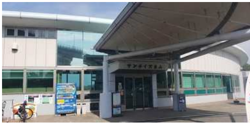
サンライズ糸山 ホテルも併設