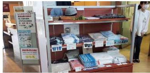
しまなみ海道オリジナルグッズ