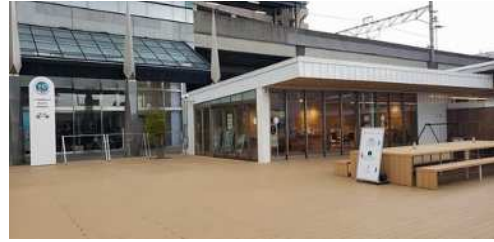
GIANTストア-観光案内所