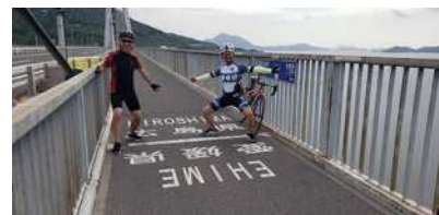
自転車専用道上の県境