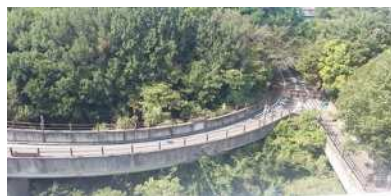
橋までのアクセス道路