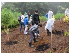
森と地下水の環境観察会