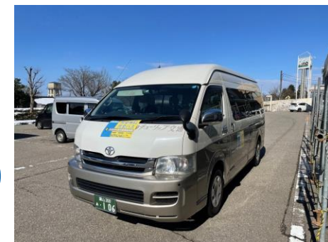
井波・庄川地域で 実証実験中の買い物バス