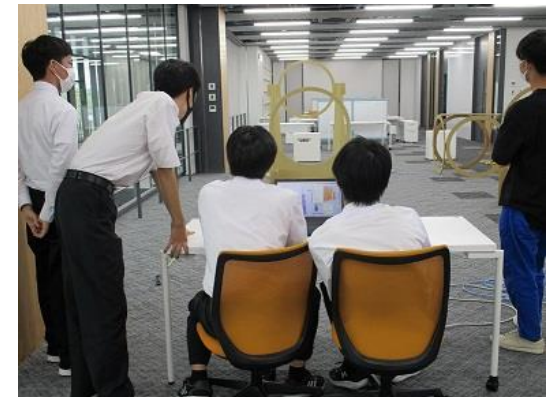
県立大学DX教育研究センター