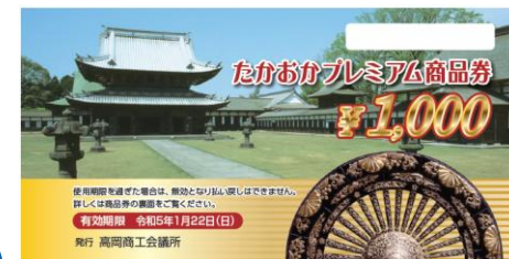
プレミアム商品券