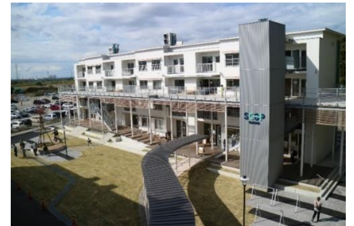
「SCOP TOYAMA」 創業支援センター・創業・移住促進住宅