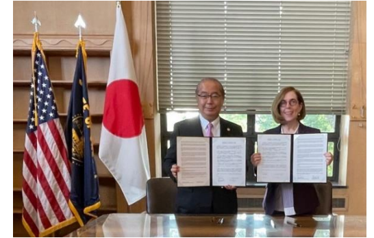
オレゴン州との経済分野等における交流と協力に関する覚書の締結

高岡テクノドーム別館の建設工事や、運営事業者選定など<令和6年度中の開館を予定>