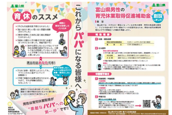
男性育休促進用チラシ