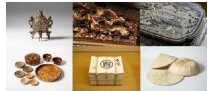
とやまの伝統的工芸品