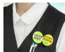
職員の缶バッジ着用