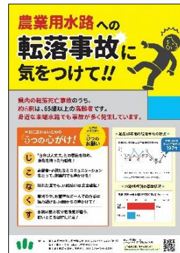
一般向け啓発チラシ