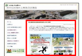
ホームページによる注意喚起

【お問い合わせ先】 富山県農林水産部農村整備課 (076-444-3375) 新川農林振興センター指導課 (0765-22-9138) 富山農林振興センター指導課 (076-444-4468)