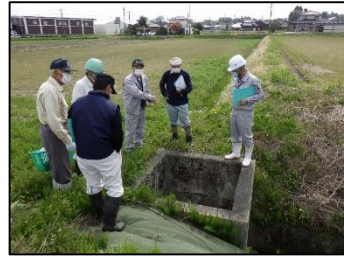
一斉点検による危険箇所の確認