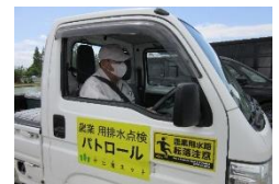
パトロール車ステッカー