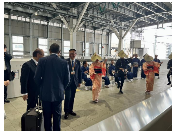
知事、富山市長がお見送り