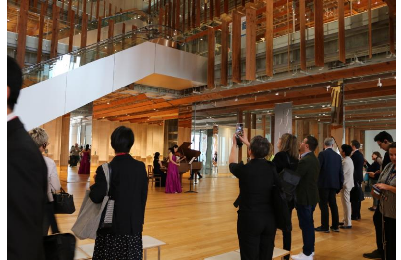
富山市ガラス美術館