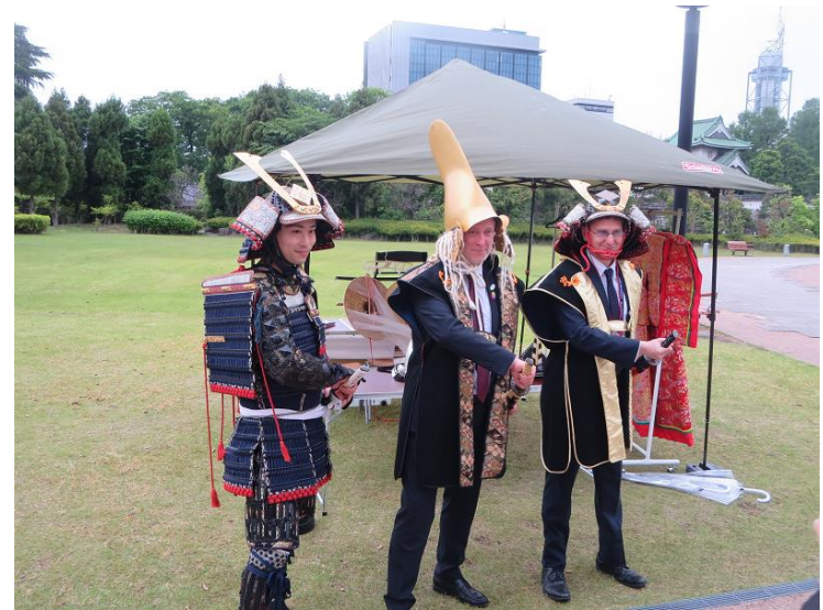
甲冑、着物体験