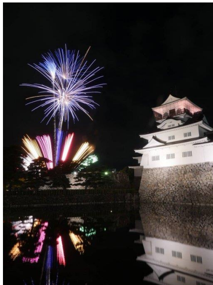
会合参加者への 歓迎の花火