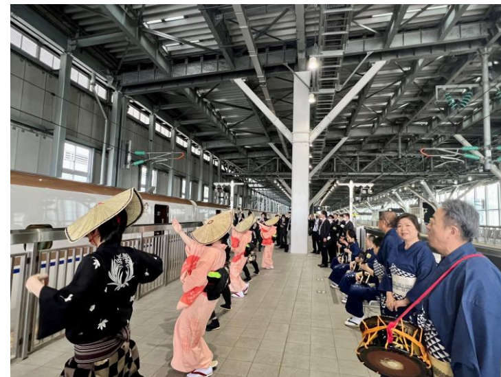
ホームでの見送りおわら