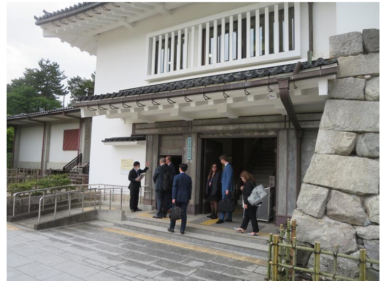
郷土博物館見学