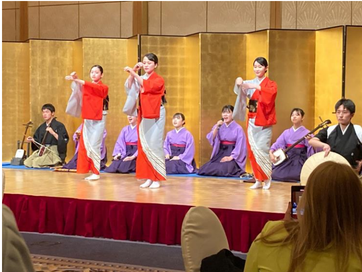
夕食会において出演 南砺平高等学校 郷土芸能部