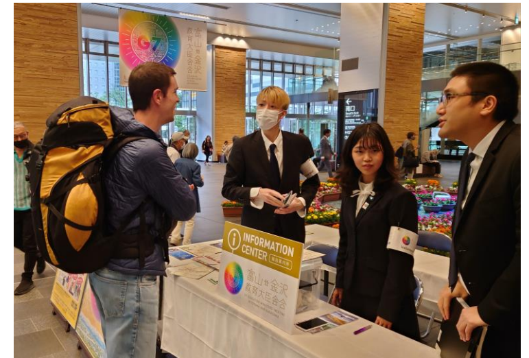
富山駅総合案内所