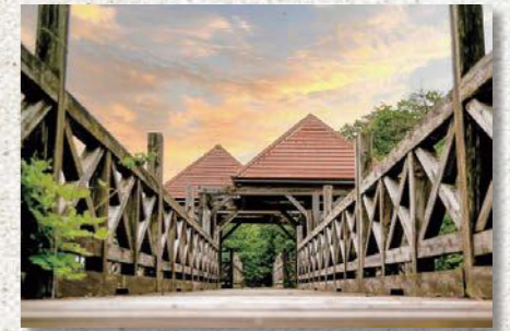
「大丈夫、渡れる...」 (題材「サクラクエスト」)