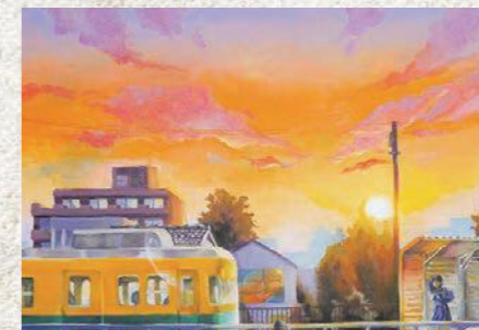
「ただいま」 (題材「路面電車の走る街 9・講談社」)