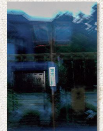
「小異の世界」 (題材「牛首村」)