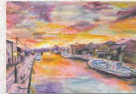
「帰りたくなる場所」 (題材「人生の約束」)