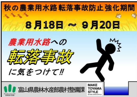
秋の事故防止強化期間のポスター