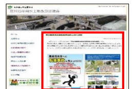
ホームページによる注意喚起