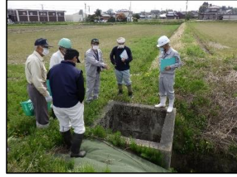
一斉点検による危険箇所の確認