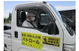
パトロール車ステッカー