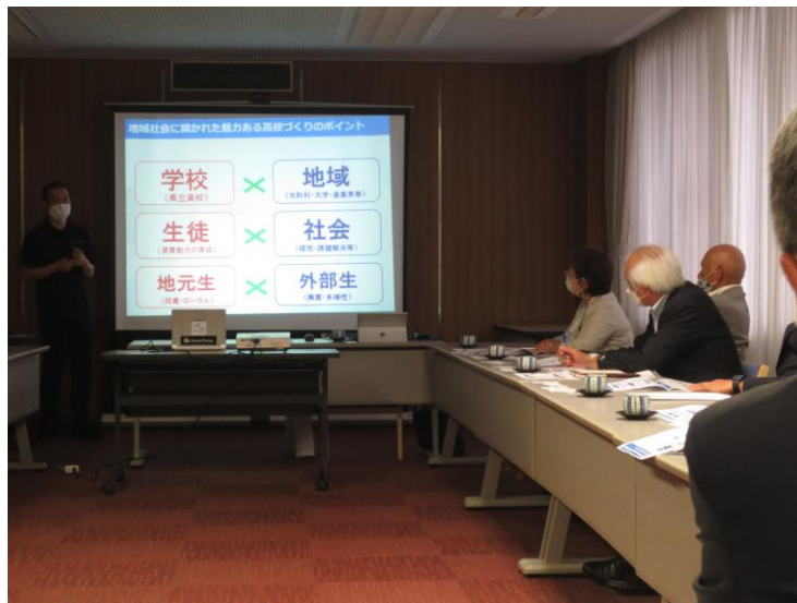
島根県議会議事堂別館