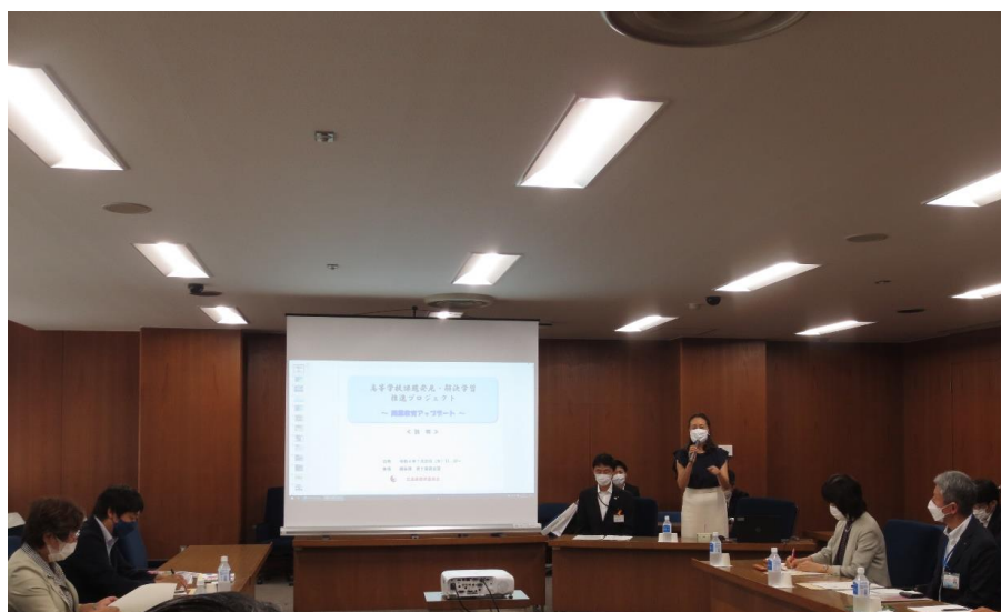
広島県議会議事堂

これからの時代を生き抜くためには、生徒の主体的な学びを促し、 知識の量だけでなく、それを活用できる力を身につけさせる教育が 必要である。生徒が授業に魅力を感じ、生き生きと学べるよう、カ リキュラムの見直しや教員の資質向上に取り組み、地域や産業界等 の外部資源も活用しながら改革を進めている。