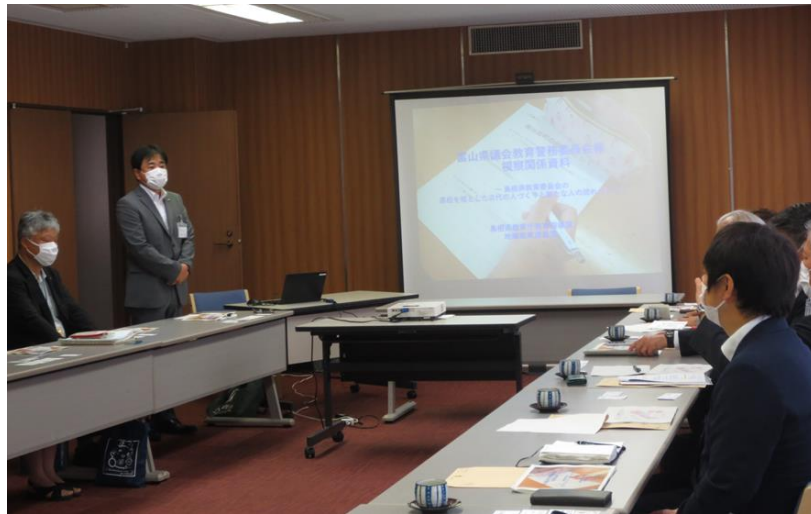
島根県議会議事堂別館

教育と地方創生を連動させるという考え方のもと、高校での学びも地域振興も進められるという好循環を生み出していくことが必要である。