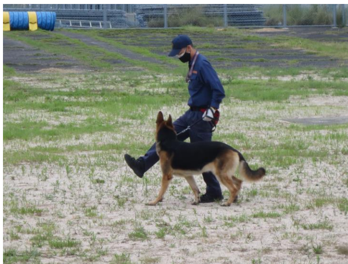
広島県警察犬庁舎