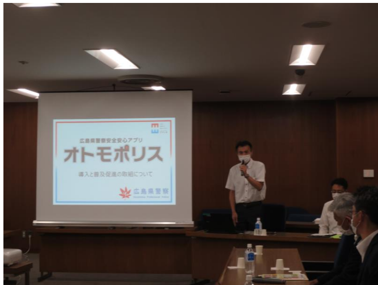
広島県議会議事堂