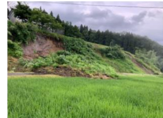
農地への土砂流入(富山市外輪野地区)