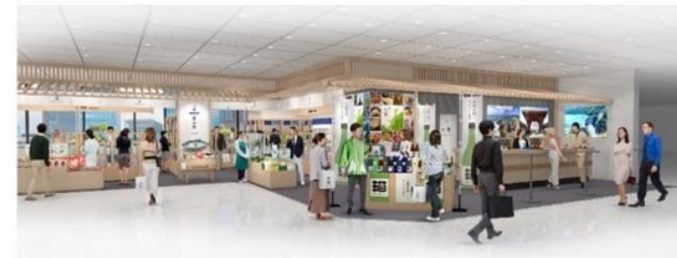
関西圏情報発信拠点(イメージ)