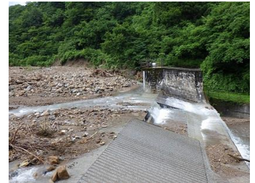
上市川第三発電所小又川 取水堰に流入した土砂