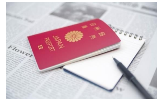
パスポート取得（イメージ）