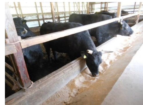
畜産農家(イメージ)

原材料及びエネルギー価格の高騰等により厳しい経営状況にある中小企業の資金繰りを支援するため、金融機関の伴走支援を要件とした融資「ビヨンドコロナ応援資金」の新規融資枠を拡充(500億円→600億円)するとともに、保証料に対する補助金を増額