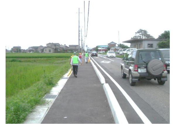
通学路安全対策の事例 (歩道整備)

土木部、農林水産部等の工事・委託業務の施行・入札・支払等に係る書類作成やデータ管理を行う「工事等事業管理システム」の再構築のための基本設計