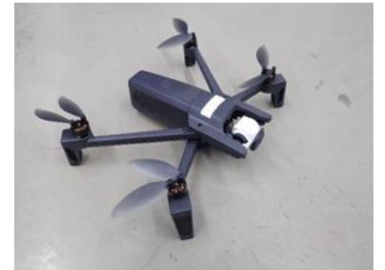
ドローン（イメージ）