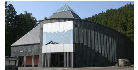
立山博物館(展示館)

文化観光拠点計画の認定を受け、立山エリアにおける文化観光を推進し観光誘客と地域活性化を図るため、拠点施設である立山博物館の情報発信や展示の磨き上げを実施