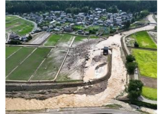
白岩川の護岸欠損(立山町白岩地区)