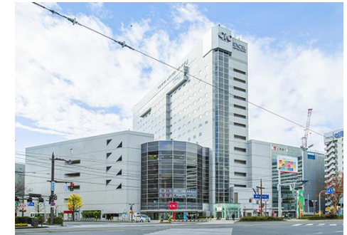
こども総合サポートプラザ 整備予定地（CiCビル）