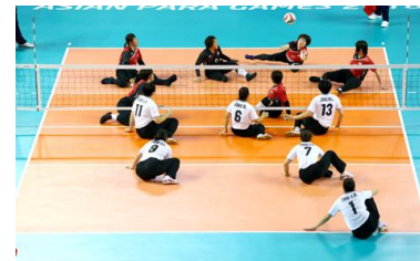
シッティングバレーボール