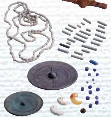
高岡市板屋谷内C6号墳出土品