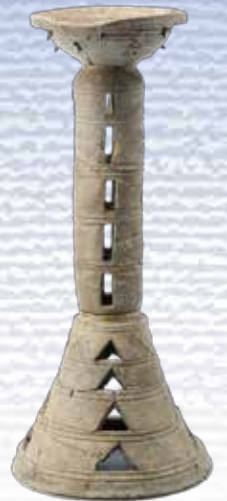
須惠器筒形器台 (氷見市加納南9号墳)

最新の科学研究を 解説します。 当センターで積極的に 進めている古墳人骨の ゲノム（DNAの全遺伝 情報）解析を紹介します。