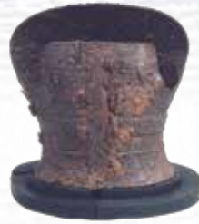
短甲 (氷見市イヨタノヤマ3号墳) 氷見市教育委員会蔵