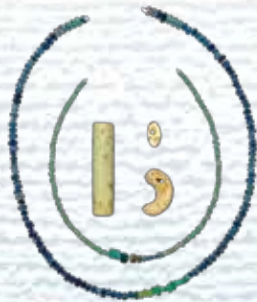
射水市小杉流通業務団地内 遺跡群古墳出土玉類