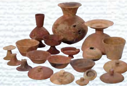
富山市勅使塚古墳出土品