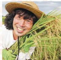
アーティスト・農家 パークマンサー