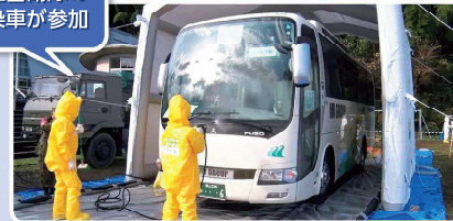
放水による車両の簡易除染