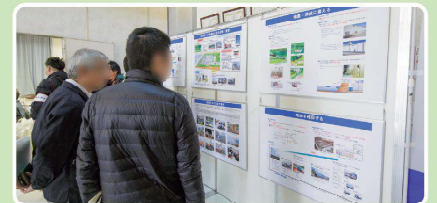
原子力防災に関する展示