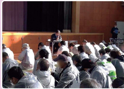
医師による安定ヨウ素剤の説明