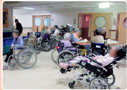
福祉施設での屋内退避