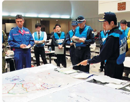
関係機関と連携した災害対策本部の設置運営訓練