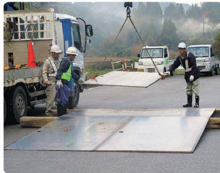
応急復旧作業の様子