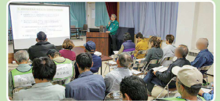
原子力防災の講習