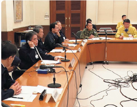
富山県庁での災害対策本部委員会議の様子

11月4日(月・振替休日)には、国や石川県等と連携し、富山県庁や氷見市役所、志賀オフサイトセンターで災害対策本部設置運営などの図上訓練を行いました。