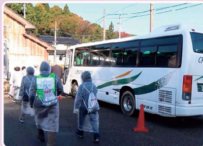
一時集合場所でバスに乗り込む様子