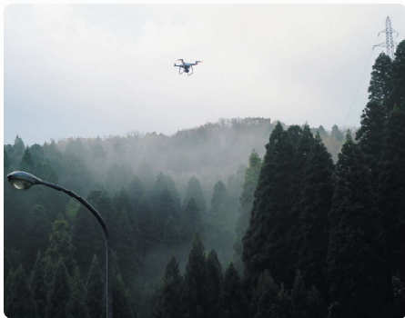
ドローンによる被災箇所の確認

住民避難等の実動訓練に併せて、地震により避難道路に段差が発生したという想定で、道路の応急復旧訓練を行いました。