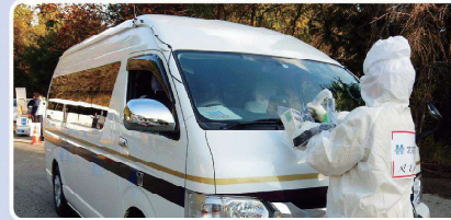
車両の放射線量の検査