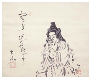
翁久允画 釈尊像 早川雪洲賛「LOVE is ALMIGHTY」