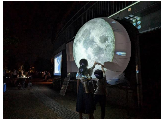
ダジック・アースの展示風景