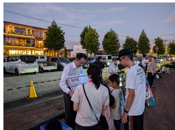
熱中症に関する普及啓発の様子

また、当日は、非常に暑かったので、開始前に打ち水を行いました。打ち水を行った直後は、地面の熱による蒸発の効果で暑さ指数（WBGT 値）が一時的に上がったものの、最終的には地面の温度と WBGT 値が大きく低下し、安心して座ることができました。効果がありましたね！