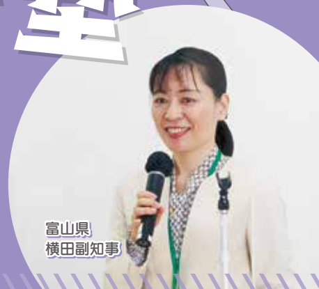
富山県 横田副知事

県内企業等における女性の活躍を一層推進するため、リーダーをめざす女性社員等の相互交流と自己研鑽を図り、業種・職種の枠を超えたネットワークを構築する「煌めく女性リーダー塾」の塾生を募集します。