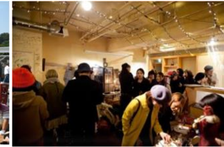
チャレンジショップ