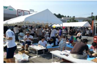
復興イベント・祭り