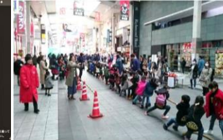
地域体験イベント