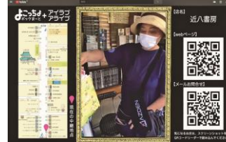
WEBを活用したハイブリットイベント