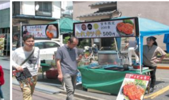
まちバル・グルメイベント