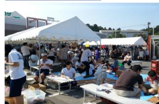
復興イベント・祭り