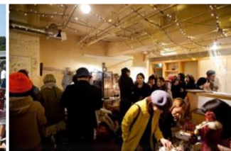
チャレンジショップ