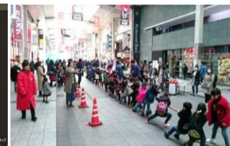
地域体験イベント