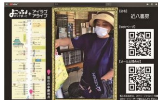
WEBを活用したハイブリットイベント