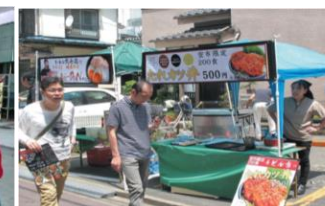
まちバル・グルメイベント