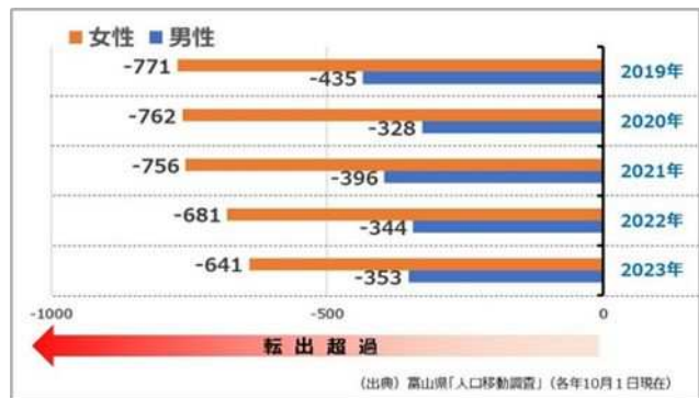
富山県 20～24歳の社会移動の状況（日本人のみ）

また、こうした県内のウェルビーイングの向上の取組みを県内外に発信し、人材交流を活性化し、人材の集積を図るため、富山県成長戦略カンファレンス「しあわせる。富山」開催事業をはじめ、デジタルコミュニティも含めた情報発信や交流の取組みを強化するとともに、県内移住につながるワーケーションやテレワークを推進する取組みも引き続き実施します。