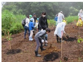
森と地下水の環境観察会

また、地下水保全に関する啓発リーフレットを作成・配布して、県民や事業者に対し、地下水保全や節水についての普及啓発を進めたほか、冬期間の地下水位低下対策のため、市町村と連携してホームページや広報紙で消雪設備等の節水に関する呼びかけを行った。（「とやまの名水」「とやま名水ナビ」「啓発リーフレット」は参考資料に掲載）