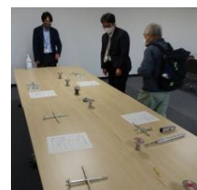
守り人講習会での 消雪設備の管理器具の展示