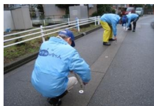
地下水の守り人の活動状況 （消雪設備の点検）